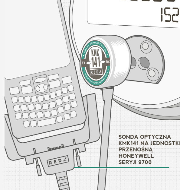
SONDA OPTYCZNA KMK141 NA JEDNOSTKĘ PRZENOŚNĄ HONEYWELL SERYJI 9700

Sonda optyczna Redz KMK141 jest zaprojektowana zgodnie z ANSI C12.18 typu 2 i jest kompatybilna ze wszystkimi markami i typami ANSI liczników. Sonda posiada interfejs o specjalnej konstrukcji przeznaczony do podłączenia bezpośrednio do przenośnych urządzeń Honeywell 9700 Series.